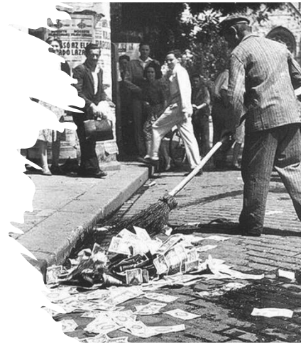
„Aranyat még sosem söpörtek az utcán”

Az arany egyedülállóan sokoldalú befektetési ajánlatot kínál kettős természetének köszönhetően, mint fogyasztási cikk és befektetési eszköz. Ez azt jelenti, hogy nagy biztonságot tud nyújtani a pénzügyi zavarok időszakában, miközben profitál az ékszerek és a technológia iránti kereslet növekedéséből a gazdasági növekedés időszakában.